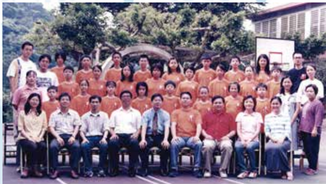
基隆市復興國民小學第六十五屆畢業生合影留念 92年6月