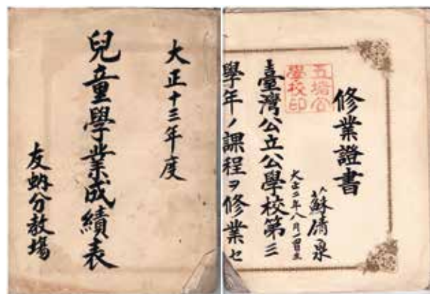
民國13年五堵公學校友蚋分教場時期成績表