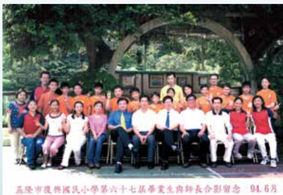
基隆市復興國民小學第六十七屆畢業生與師長合影留念 94.6月