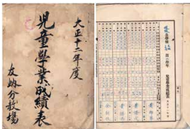
民國12年暖暖公學校友蚋分教場時期成績表