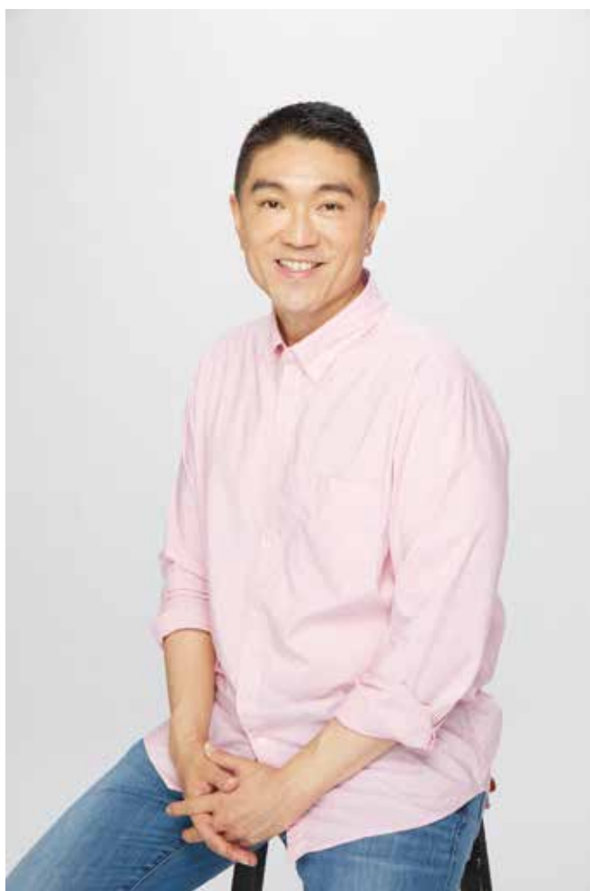
基隆市市長 謝國樑

百年校慶是一個值得慶賀的里程碑，也是對復興國小一百年來殷勤耕耘的教育工作者和莘莘學子們的莊重肯定。復國小在過去培養了一批批優秀的學生，為基隆市發展做出了重要貢獻。現今全球化促成社會、經濟與科技的快速變遷，人才的培育需具備更彈性的思維，基隆全面導入國際上成功的教學模式，我們也看見復興國小辦理各種特色課程，培養學生多元的核心素養與探索興趣。