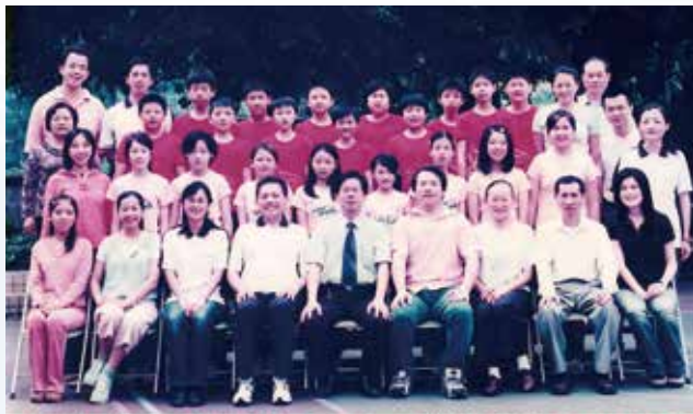
基隆市復興國小第六十八屆應屆畢業生合影留念 95年6月