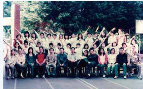
基隆市復興國小第六十九屆應屆畢業生合影留念 96年6月