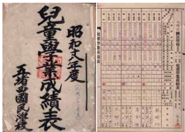
民國32年五堵西國民學校時期成績表