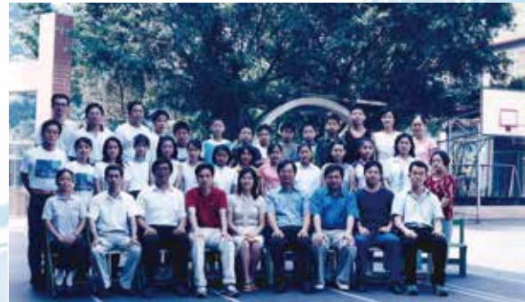
基隆市復興國民小學第六十四屆應屆畢業生合影留念 91年6月