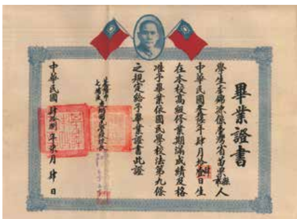
民國48年友蚋國民學校時期畢業證書