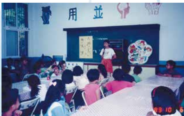
自治市長政見發表