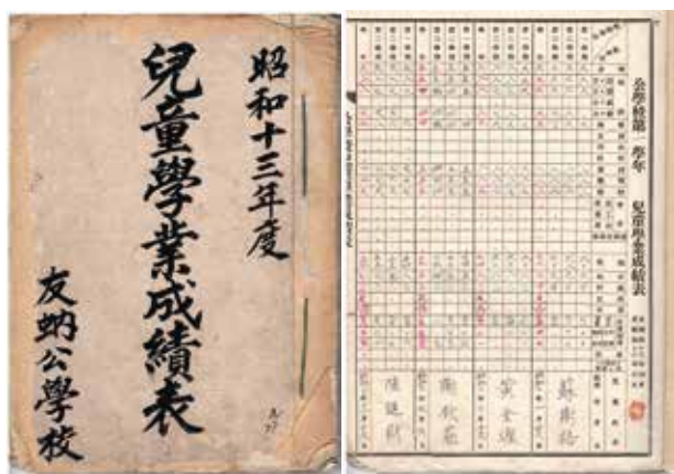
民國27年友蚋公學校時期成績表