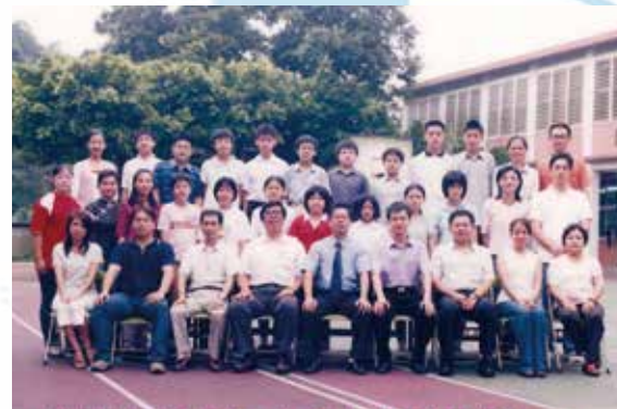
基隆市復興國民小學第六十六屆畢業生與師長合影留念 93.6