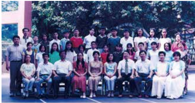
基隆市復興國民小學第六十二屆應屆畢業生合影留念 89年6月